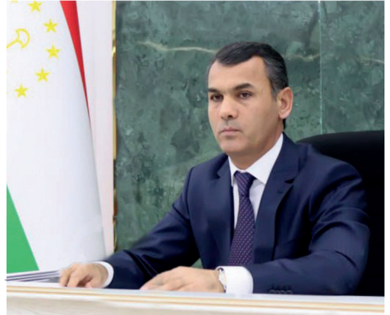
Мирзозода РУСТАМ ПИРАҲМАД, Раиси Суди Олии Ҷумҳурии Тоҷикистон

Дар заминаи чунин дастурҳои Пешвои миллат “Барномаи ислоҳоти судӣ-ҳуқуқӣ дар Ҷумҳурии Тоҷикистон барои солҳои 2019-2021” бо мақсади таҳкими минбаъдаи ҳокимияти судӣ, ҷараёни мурофиаи судӣ, нақши суд дар ҳифзи озодии инсон, ҷимояи манфиатҳои давлатӣ, таъмини адолат ва тақмили фаъолияти мақомоти судӣ ва шаффофияти низоми судӣ дар ҳими ҳуқуқҳои шаҳрвандон аз 19-уми апрели соли 2019 таҳти №1242 тасдиқ гардид, ки он аз 4 банд, 15