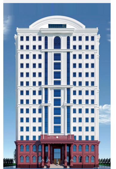
СУДИ ОЛИИ ҶУМҲУРИИ ТОҶИКИСТОН

НАШРИЯИ РАСМИИ СУДИ ОЛИИ ҶУМҲУРИИ ТОҶИКИСТОН №1 (01) ЯНВАР 2026