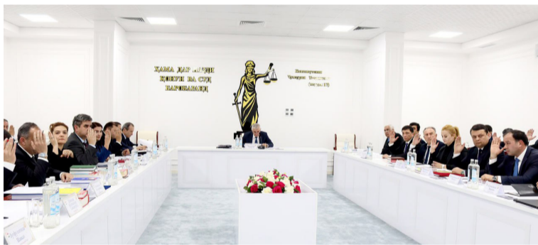
аз ҷониби гурӯҳҳои кори Суди Олӣ судяҷо таҳия гардида будаанд, ҳамчун як роҳнома барои судяҷо қабул

ва тасдиқ карда шуда. Ҳамзамон дар идомаи кори ҷаласаи Пленум як қатор қарорҳои дигар низ бо мақсади таъмини иҷрои бандҳои дахлдори Нақшаи амал барои солҳои 2023-2025 ба Стратегияи миллии Ҷумҳурии Тоҷикистон дар соҳаи ҳифзи ҳуқуқи инсон барои давраи то соли 2038 қабул гардиданд, ки аз тавзеҳоти муҳиму саривақтӣ, беҳтар намудани фаъолияти судҳо, мутобиқсозии амалияи судӣ ба талаботи қонунгузори амалкунанда ва баланд бардоштани самаранокии фаъолияти ҳокимияти судӣ иборат мебошанд.