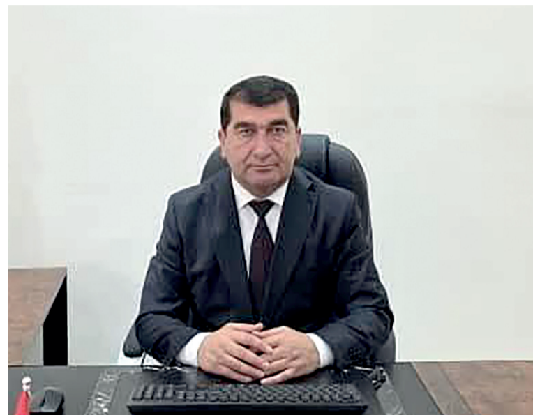
Раҷабзода ҲОТАМ НАЗАР, муовини Раиси Суди Олии Ҷумҳурии Тоҷикистон – Раиси коллегияи ҳарбӣ

Ҳоқимияти судӣ – на танҳо ниҳоди ҳалкунанда, балки субъекти фаъол дар низоми пешги-