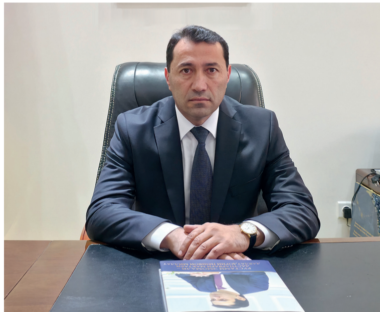
Тағозода АБДУҚАҲҲОР САИДМУРОД, муовини Раиси Суди Олии Ҷумҳурии Тоҷикистон

Вобаста ба мақоми Суди конститусионӣ Президенти Ҷумҳурии Тоҷикистон дар суҳанронии худ ба муносибати 15-умин солгарди қабули Конститутсия иброз намуд, ки «дар низоми судии кишвар Суди конститусионӣ мақоми махсус дорад ва яке аз вазифаҳои аввалиндараҷаи он таъ-