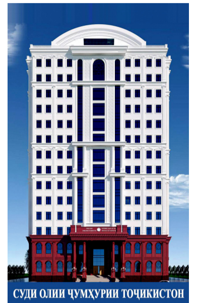
СУДИ ОЛИИ ҶУМҲУРИИ ТОҶИКИСТОН

НАШРИЯИ РАСМИИ СУДИ ОЛИИ ҶУМҲУРИИ ТОҶИКИСТОН №3 (03) 26 ФЕВРАЛИ 2026