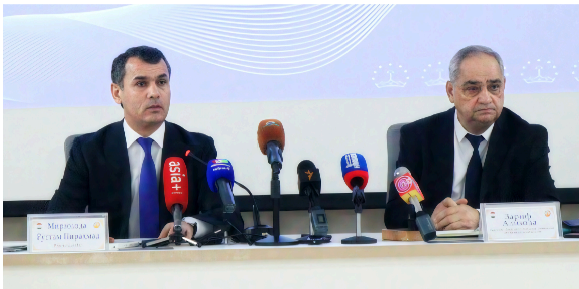
12-уми феввали соли 2026 дар бинои Суди Олии Ҷумҳурии Тоҷикистон мутобиқи амри Президенти Ҷумҳурии Тоҷикистон аз 4 – уми марти соли 2005, тахти №АП – 1677 чиҳати ташкил ва баргузори нишастҳои матбуотӣ дар вазорату идораҳои нишастии матбуотии Мирзозода Рустам Пираҳмад, Раиси Суди Олии Ҷумҳурии Тоҷикистон оид ба натиҷаҳои фаъолияти ҳокимияти судӣ дар соли 2025 баргузор гардид.

Дар қараёни нишастии матбуотӣ Ализода Зариф, Ёрдамчии Президенти Ҷумҳурии Тоҷикистон оид ба масъалаҳои ҳуқуқӣ, муовини, раисони коллегии судьяҳо, судьяҳо ва сардорони раёсатҳои Суди Олӣ, инчунин намояндагони васоити ахбори оммаи Ҷумҳурии Тоҷикистон ширкат варзиданд. Нишастии матбуотӣ тахти раёсати Раиси Суди Олии Ҷумҳурии Тоҷикистон оғоз гардид, зимнан муҳтарам Мирзозода Рустам Пираҳмад дар ҳузур намояндагони матбуот ва расонаҳои ахбори омма оид ба на-