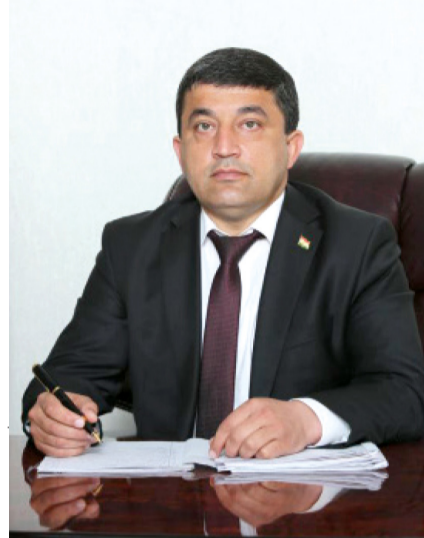
Суҳроб РУШАНЗОДА, Раиси суди вилояти Суғд

ҳокимияти судӣ метавонанд дар раванди рушди миллии, саодати мардум, расидан ба ояндаи дурахшон, тадбиқи ҳадафҳои стратегии кишварамон саҳм гузоранд ва боварии мардумро ба фардои нақв ва тараққиёти кишварамон, инчунин таъмини зиндагии шарафмандони аҳолии мамлакатамон қавӣ гардонанд.